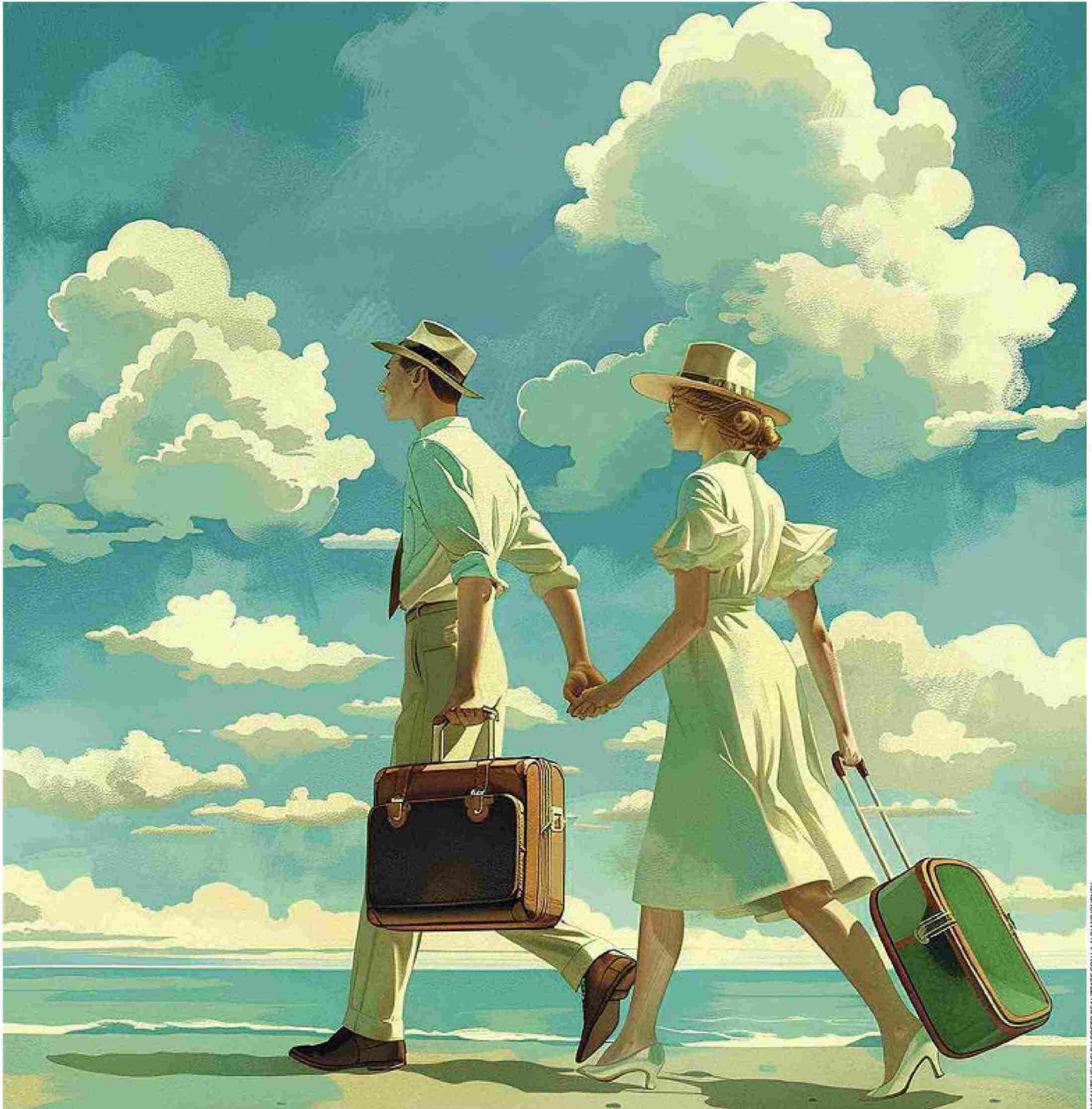
VACANZE VELOCI D'AGOSTO REALIZZATE CON LA AI DI MIDJOURNEY

Ritaglio stampa ad uso esclusivo del destinatario, non riproducibile.